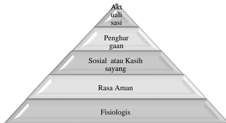
Gambar 1. Piramida kebutuhan menurut Maslow

motivator utama bagi perilaku berikutnya.(Wahyudi, 2010: 3). Kelima kebutuhan Maslow tersebut seringkali disajikan dalam suatu piramida kebutuhan sebagai berikut: